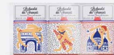
Le Chocolat des Français

Trio de 3 mini tablettes édition limitée «Lapin»