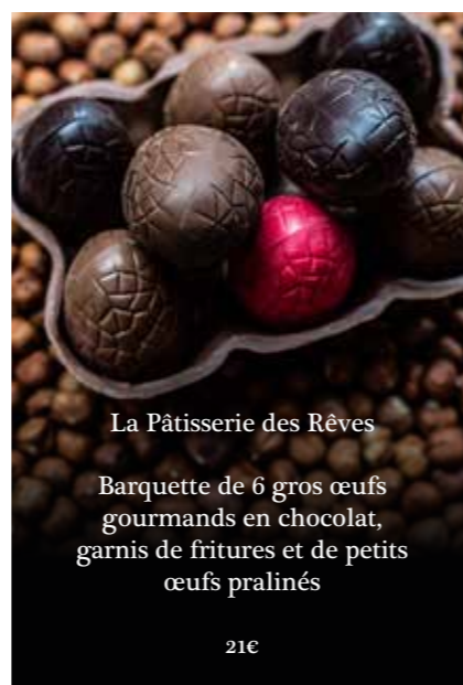
La Pâtisserie des Rêves

Barquette de 6 gros œufs gourmands en chocolat, garnis de fritures et de petits œufs pralinés