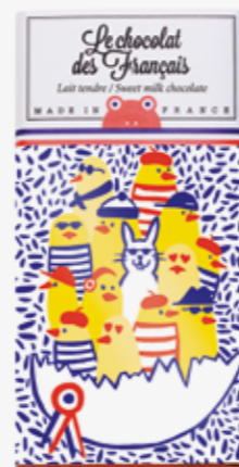
Le Chocolat des Français

Tablette chocolat au lait édition limitée « Poussins »