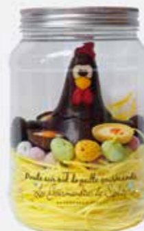
Les Gourmandises de Sophie